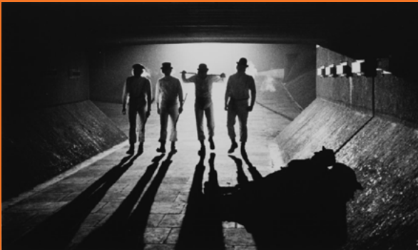
A Clockwork Orange - Stanley Kubrick (1971)

Forsi xi wħud minnkom semgħu bil-film A Clockwork Orange tal-famuż direttur Stanley Kubrick. Oħrajn forsi qraw il-ktieb bl-istess titlu miktub minn Anthony Burgess. U forsi oħrajn minnkom qatt ma semgħu bih. Ma jimpurtax. Ejja nibdew mill-bidu.